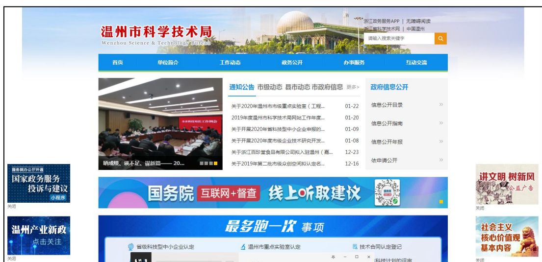
图 2 市科技局门户网站 (http://wzkj.wenzhou.gov.cn)