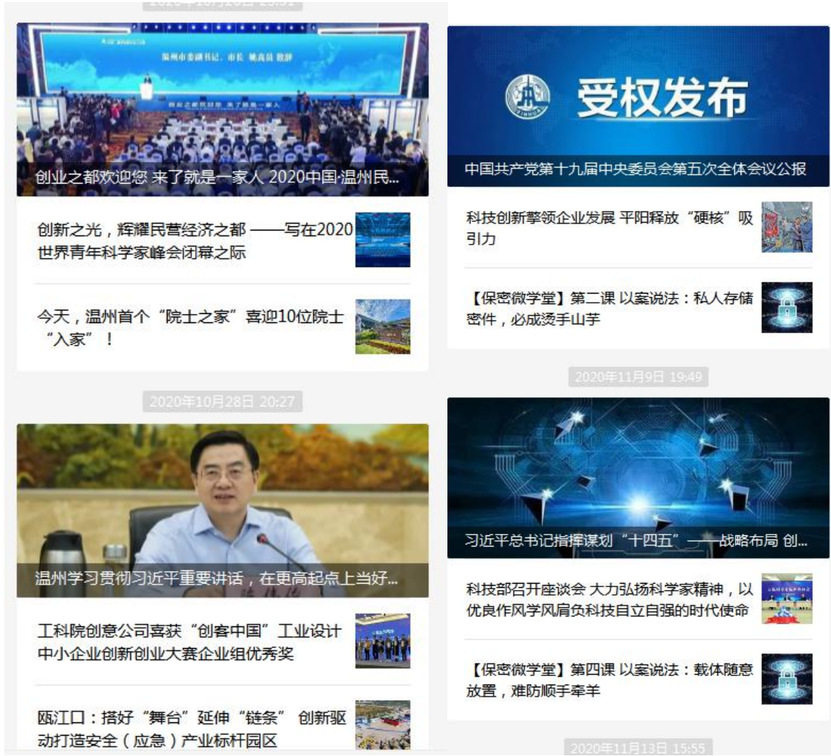
图 3 创新温州微信公众号