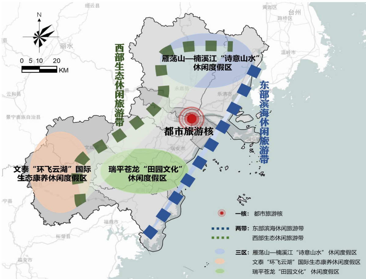
图 1 “十四五”温州市旅游业发展空间格局图

苍南世界矾都 312 矿硐旅游等一批项目开发，积极培育瑞安湖岭天然温泉小镇、瑞安木活字小镇、平阳乐清山海协作生态旅游文化产业园、苍南炎亭省级度假区、龙港社区微旅游等一批生态休闲、乡村度假项目，打造田园文化和旅游发展的示范样本。