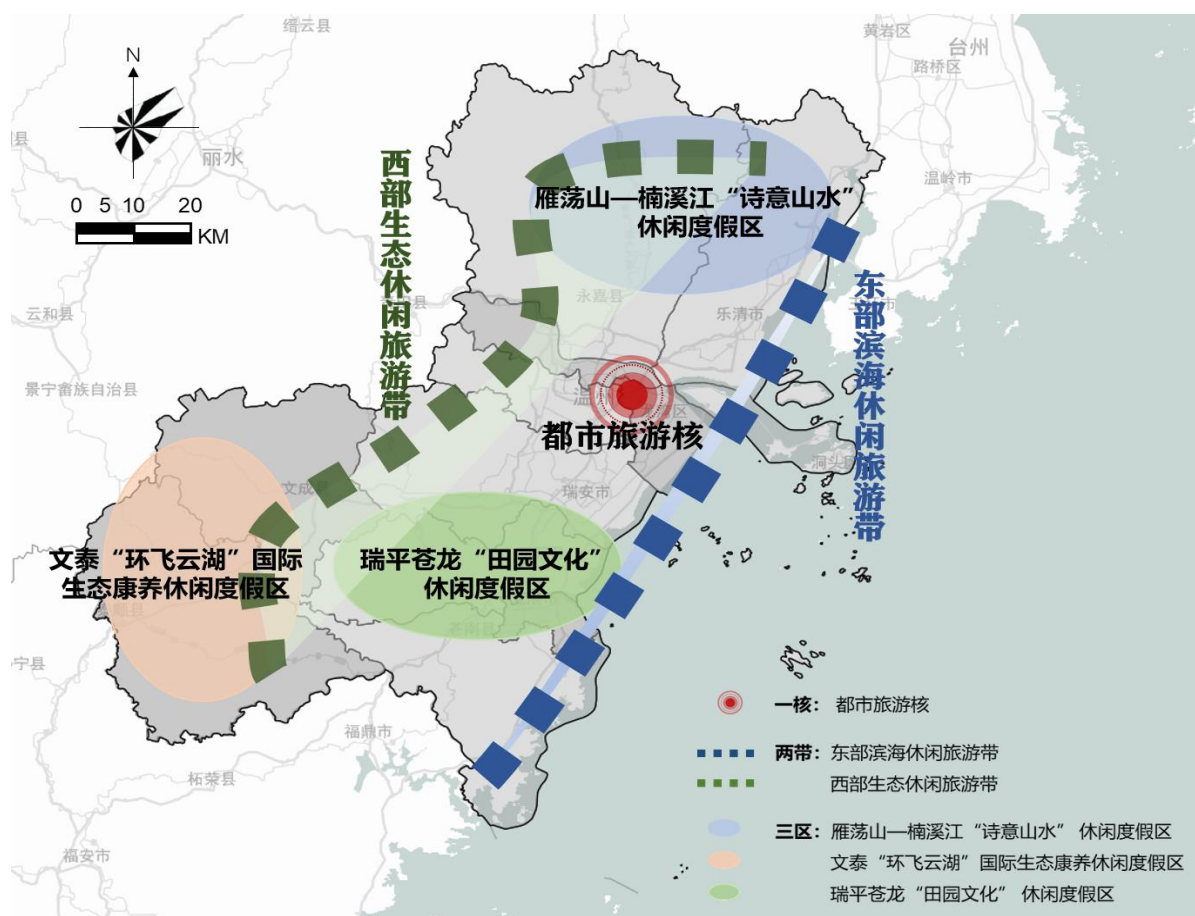
图 1 “十四五”温州市旅游业发展空间格局图

苍南世界矾都 312 矿硐旅游等一批项目开发，积极培育瑞安湖岭天然温泉小镇、瑞安木活字小镇、平阳乐清山海协作生态旅游文化产业园、苍南炎亭省级度假区、龙港社区微旅游等一批生态休闲、乡村度假项目，打造田园文化和旅游发展的示范样本。