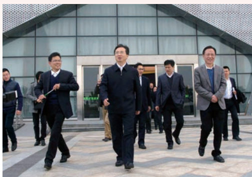
3月6日，市委书记调研瓯江口产业集聚区。