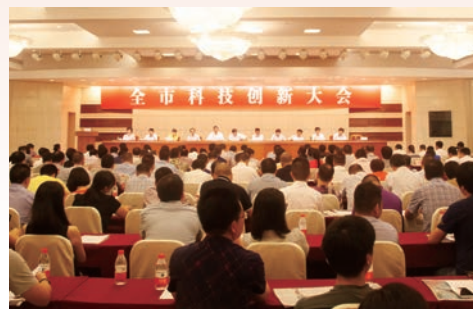
2016年8月19日,市委、市政府隆重召开全市科技创新大会

围绕“五水共治”,组织实施科技治水项目。深化科技特派员工作,优秀科技特派员先进事迹得到省市领导高度肯定。启动“星创天地”试点建设和培育工作,3家单位成为首批国家级“星创天地”。