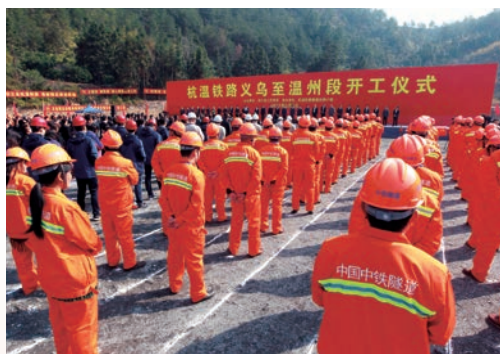
3月9日，杭温铁路义乌至温州段工程在永嘉县东城街道长源村开工建设。