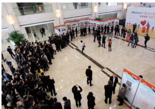
3月8日，“慈善一日捐”活动在市行政中心举行。