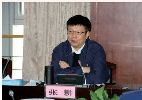
3月14日，市委副书记、市长张耕调研市场监管工作。