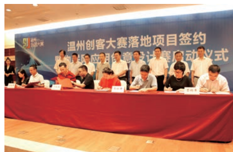
2016年9月29日,温州创客大赛12个重点项目签约落户