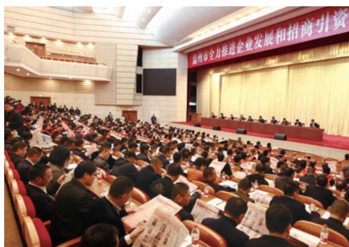
3月10日，温州市全力推进企业发展和招商引资大会召开。