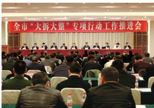
3月7日，全市“大拆大整”专项行动工作推进会召开。