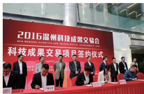
2016年11月4日-5日,温州科技成果交易会举行