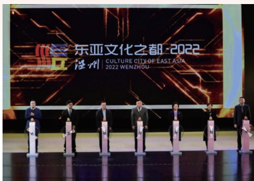
12月15日，“2022东亚文化之都·中国温州活动年”闭幕式暨“戏从东瓯来”南戏经典剧目展演于温州大剧院举行