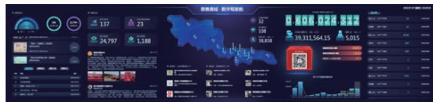
慈善鹿城数字驾驶舱

一是慈善服务智慧化升级。整体智治,创新开发“慈善鹿城”数字化系统,搭建慈善参与“一码通”、慈善积分“一键算”、捐款流向“一扫清”等多跨场景,将其接入“慈善鹿城”公众号并成功上架浙里办。注册用户超5万人,致力让“指尖慈善”成为时尚潮流。二是慈善资源高效率匹配。聚焦困难弱势群体需求,整合20余个部门资源数据,梳理32个供给选项和112项需求清单。实现供给端自由选择和需求端自主申报“双向贯通”,解决低收入群体急难愁盼问题2000余个。三是慈善资金全流程追溯。建设慈善组织活动信息监管平台,探索建立慈善捐款可查询、可追溯的智能反馈机制。率先在民政部门增加对社区、慈善组织资金的监管职能,完成“阳光慈善”捐款系统测试版,推动善款与慈善项目自动匹配,实现“随手捐”“随手查”。