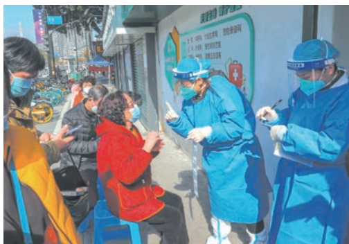
我市向困难群众免费发放退烧药