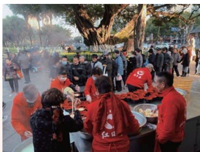
红日亭公益活动现场