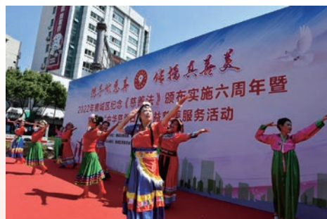
鹿城举行纪念《慈善法》颁布实施六周年暨第七个“中华慈善日”公益慈善服务活动