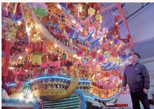
12月12日，非遗乐清首饰龙“飞”出国门，将亮相明年5月在美国纽约举行的首届瓯越文化街坊节活动