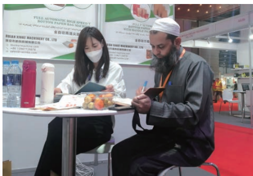
第十三届中国（阿联酋）贸易博览会举行，图为外商在温企展区洽谈业务