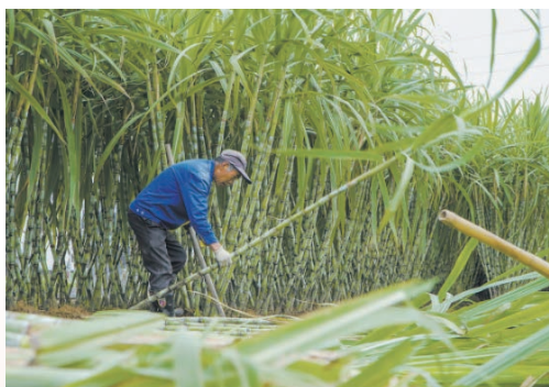
瑞安市陶山镇甘蔗田迎来丰收，农户正在采摘甘蔗