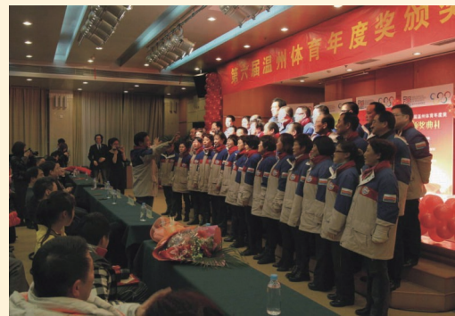
2月28日，第六届温州体育年度颁奖仪式在温州日报大厦举行。