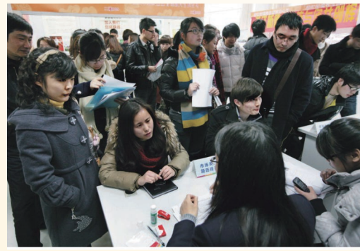
2月4日，2012年温州春季人才交流大会在市人才大厦举行。