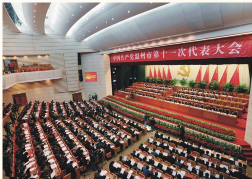
2月8日，中国共产党温州市第十一次代表大会在市人民大会堂开幕。