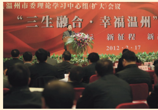
~% $* W 主题的中共温州市委理论学习中心组（扩大）会议在市人民大会堂举行。