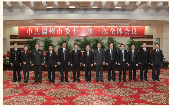
2月11日，新一届市委常委合影，左起为：黄宝坤、胡剑谨、雷林、李一飞、葛益平、王昌荣、陈德荣、陈金彪、彭佳学、陈作荣、陈晓明、吴开锋、王立彤。