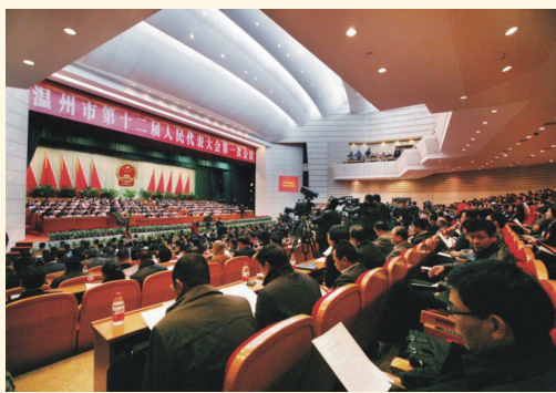
2月21日，温州市第十二届人民代表大会第一次会议在市人民大会堂开幕。