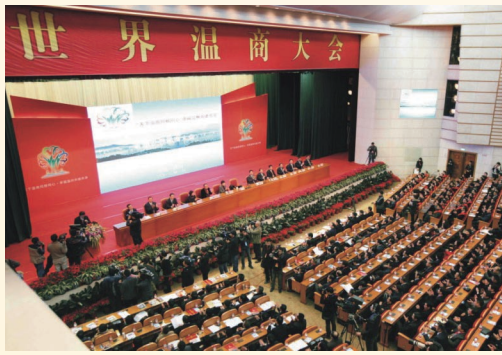
2月1日，世界温商大会在市人民大会堂开幕。