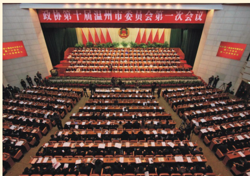
2月20日，政协第十届温州市委员会第一次会议在市人民大会堂开幕。