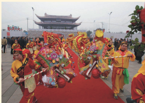
2月22日，温州“2012拦街福”民俗活动在市区锦江路举行。