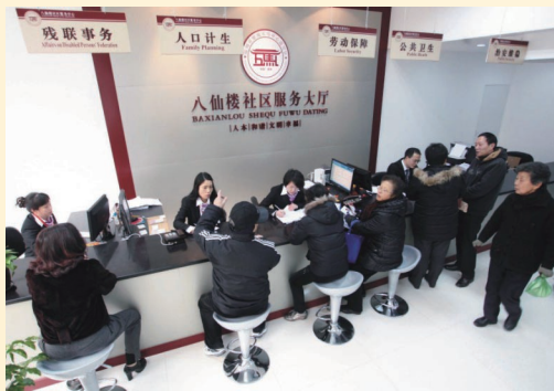
2月27日，我市首个社区服务中心在五马街道八仙楼社区开张。