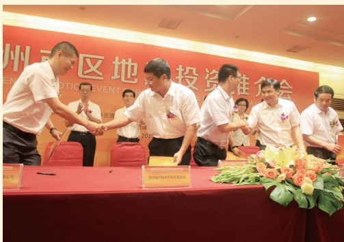
8月25日，由市公共资源管委办等单位主办的市区地产投资推介会在市人民大会堂举行。