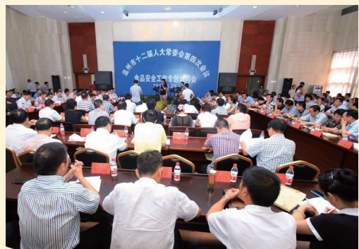
8月29日，市人大常委会召开食品安全工作专题询问会。