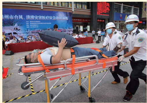
8月10日，市应急办牵头开展台风、洪涝灾害医疗应急救援演练。