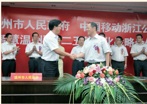
8月7日，市政府与中国移动浙江公司签订“无线城市·智慧温州”十二五信息化战略合作协议。