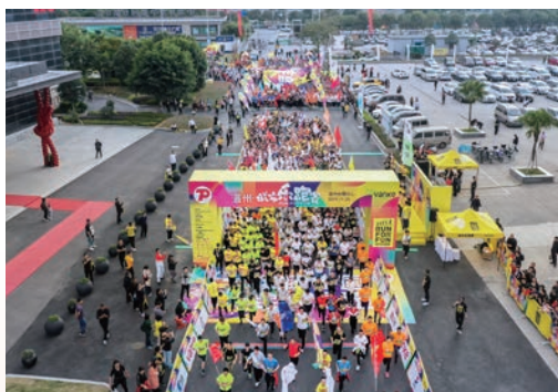
11月23日，温州城市乐跑赛开跑