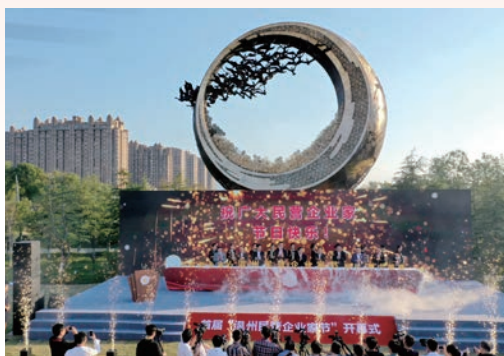
11月1日，首届“温州民营企业家协会”开幕