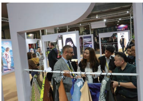
11月8日，国际时尚消费暨第十五届浙江（温州）轻工产品博览会开幕