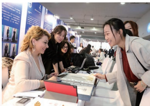
11月26日，首届“中国·民营企业人才周”开幕