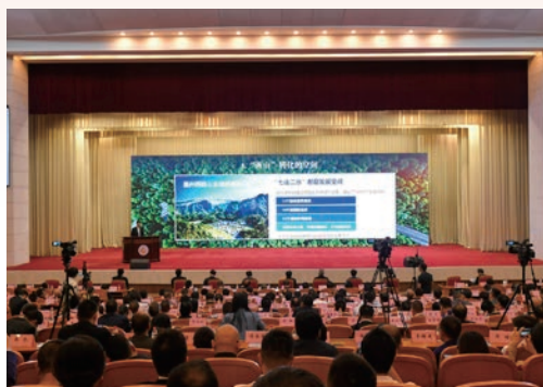
11月2日，中国（温州）新时代“两个健康”论坛召开