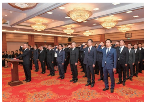
11月14日，市政府任命的部分国家工作人员举行宪法宣誓仪式