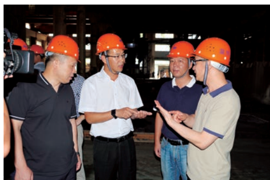
苗伟伦副市长带队赴永嘉开展特种设备安全工作督查