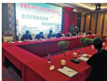
永嘉泵阀产业集聚区获得“全国知名品牌创建示范区”称号