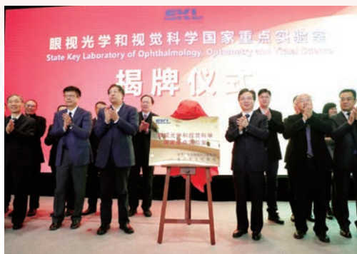
12月14日，省部共建眼视光学和视觉科学国家重点实验室揭牌仪式在温州医科大学举行。