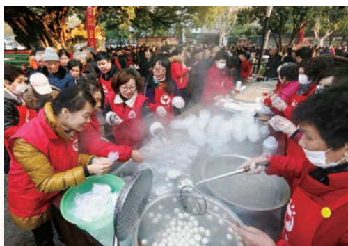
12月22日冬至，在全国学雷锋示范点——鹿城区红日亭，志愿者们将一碗碗热腾腾的汤圆送到路人手中。