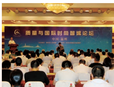
市政府举办质量与国际时尚智城论坛