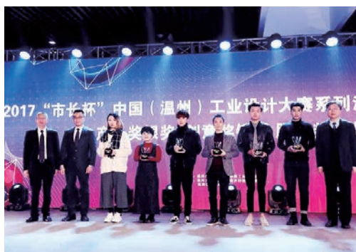
12月27日，2017“市长杯”中国（温州）工业设计大赛总决赛系列活动暨颁奖典礼在瓯海时尚智造小镇举行。