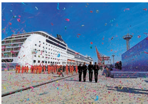
12月9日，温州国际邮轮港开港首航仪式在洞头区举行，2517名游客乘坐地中海“抒情号”邮轮开启五天四夜的海上之旅。