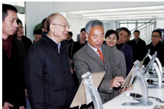
国家质检总局支树平局长调研温州质量工作

深化改革转职能,政务服务提质增效。 31项行政审批事项全部实现了“一次不跑”,办理“最多跑一次”事项共12507件,市本级100%的质监行政审批事项实现“零上门”,在全市各部门中提前实现所有行政审批许可事项“最多跑一次”目标,工作经验在全市会议上作交流介绍,并得到市政府主要领导的批示肯定。