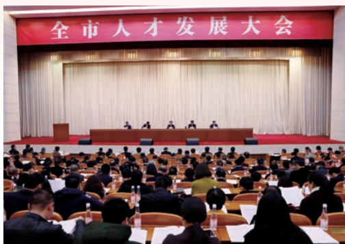
12月7日，市委市政府召开全市人才发展大会。