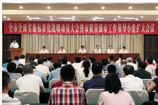
温州市全面实施标准化战略动员大会举行