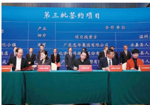
12月26日至27日，第三届粤港澳温州人大会在广州举行。图为招商引资项目签约仪式。