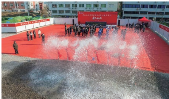
1月16日,瓯江南北联网保供水应急工程(乐清片)正式通水,有效化解乐清旱情

三是频施惠民利企举措,擦亮优化营商环境的公用名片。 结合“最多跑一次”等要求,在全省率先破除供水、供气“各自为政、业务单一”的传统运营管理模式,大力开展公用服务体系规范化、标准化建设,整合建立公用便民服务大厅,集成线上线下资源,实行水气服务“一窗同办、全城通办”和不动产登记“水、气”联动办理过户,公用服务模式实现了多个阶段迭代升级。目前,集团所有44个对外公开事项均可网上办理“不用跑”,“一证通办”覆盖率、网上办事率、跑零次率、掌上办事实现率实现四个100%。创新推出非居客户用水用气报装“零材料、零上门、零审批、零投资”服务模式。同时,为解决基层矛盾纠纷,全国首创覆盖范围广、赔付标准科学、理赔速度快的“水惠安”保险服务,已为43万户居民投保,完成保险理赔2458户,赔付金额共263.6万元,户均获得约1100元补偿,供水纠纷较保险投用前下降50%;全省率先推行“燃气卫士”家庭综合保险,为市民提供用气安全和家庭财产双重保障,已投保7463户。