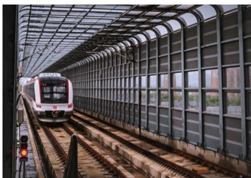
4月15日，市域铁路S2线列车从龙湾永兴站驶出，开始空载试运行