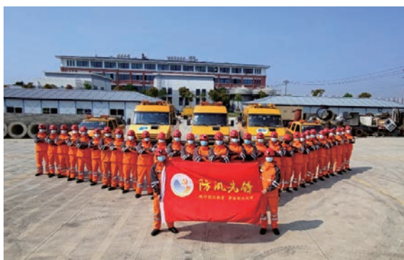
排水公司建立防汛先锋队,进一步巩固市区防汛防台战线