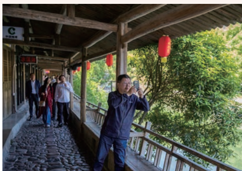
4月9日至13日，全国文学名家采风行“东瓯笔会”活动在我市举行，与会文学名家深入温州的历史巷弄与山水乡愁