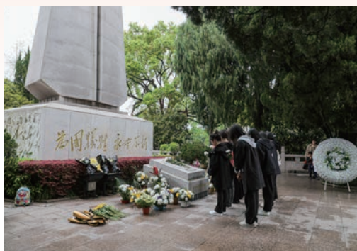
4月5日，我市多单位、社会团体及个人自发前往温州革命烈士纪念碑祭扫，缅怀革命先烈