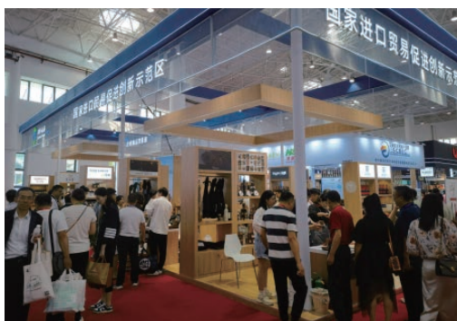
4月11日，为期5天的第三届中国国际消费品博览会在海南省海口市开幕，中国·瓯海首次亮相该博览会