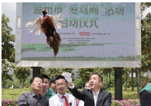
4月21日，我市第42个“爱鸟周”活动启动，目前我市野生鸟类有500余种，约占全国鸟类总数的33%