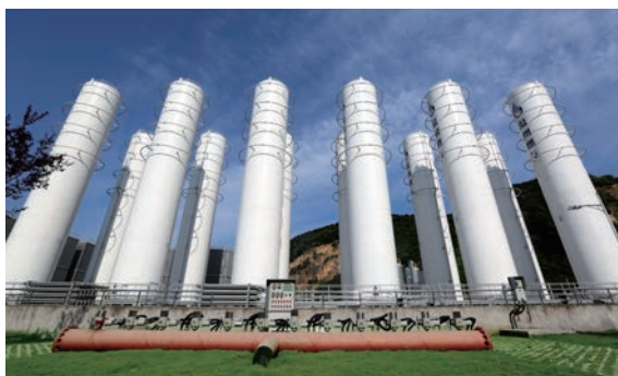
市中LNG应急气源站,供气存储量620吨,保障市区2-3天应急供气需求