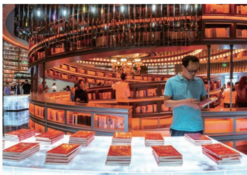
4月，“书香社会 阅读温州”全民阅读节启动，“全国最美书店”钟书阁温州首店在温州湾新区开业