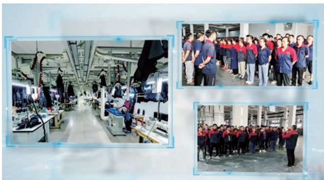
企业自主开展风险隐患自查自纠