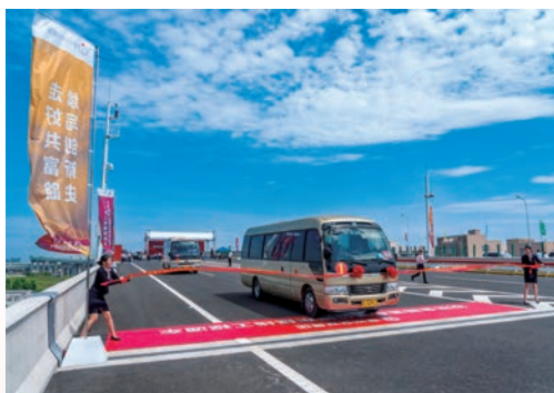
6月20日，金丽温高速公路东延线（S40龙湾联络线）通车运营，该项目是温州市“两纵两横两连一绕”高速公路网中重要组成部分，也是温州市首条城区高速公路