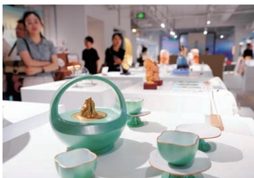
6月17日，第四届温州国际设计双年展在瓯海区三垟湿地城市客厅开幕