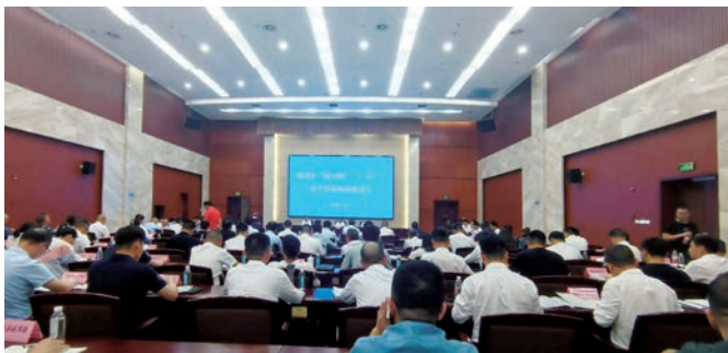
2023年5月16日,在全市“国中国”“厂中厂”安全整治现场推进会上部署推进全市行业协会安全生产自律管理

三是开展隐患自查自纠。 借力“企检服务中心”推行“刑事合规+行政合规+行业合规”的企业“三合规”建设模式,凝聚行政执法机关、工商联、高校等多方合力,引导会员企业依据自律标准、负面清单主动开展安全生产管理“一月一自查”、“一季一互查”、“半年一巡查”,及时提供风险预警信息,督促自觉开展隐患治理,有效落实安全生产主体责任。同时,积极推进安全生产先进技术(安全设备)的推广与落后技术(危险设备)的淘汰,持续推动风险防范关口前移,努力从源头上防范化解重大安全风险。自今年4月开展隐患大排查大整治行动以来,企业自查自纠安全生产隐患397225个,整改率达100%。