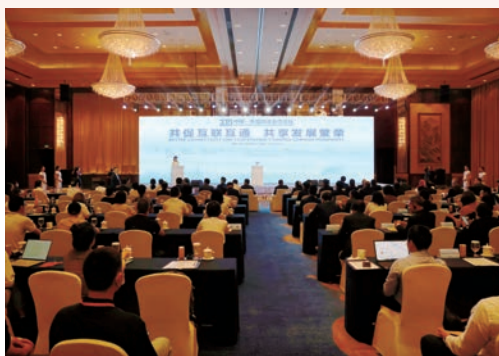
6月12日，2023中国—东盟媒体合作论坛在温举行