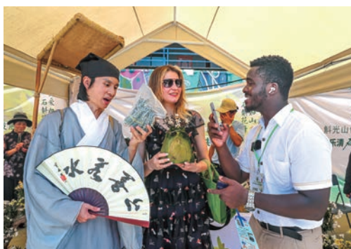
6月18日，2023乐清石斛花开共富节开幕