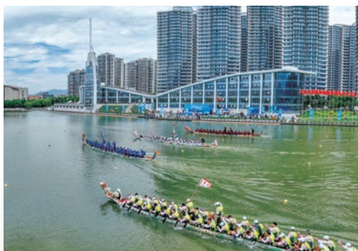
6月19日，2023全民龙舟竞演活动在亚运会龙舟比赛主会场浙江省温州龙舟运动中心举办