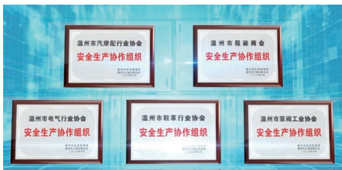
在传统支柱行业协会先行组建行业协会安全生产协作小组