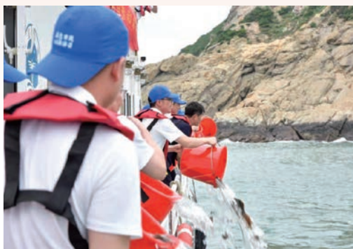
6月8日，2023年“世界海洋日暨全国海洋宣传日”系列活动在平阳县南麂岛启动