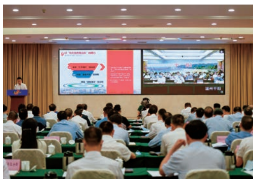
5月12日，“温州擂台·六比竞赛”2020年第一次全市乡镇（街道）党（工）委书记工作交流会在市人民大会堂四楼新闻发布厅举行，会上10位乡镇街道“一把手”逐一进行发言