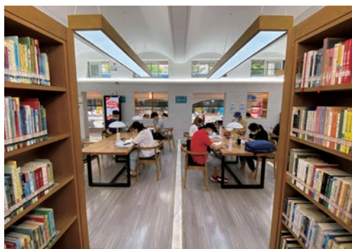
我市城市书房陆续开放，截至5月28日，有22家城市书房已正式实施限时限流开放，读者进入前需测量体温和出示健康码