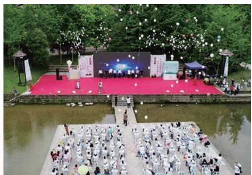
5月16日上午，永嘉县首届“家庭教育主题宣传周暨家庭研学游活动”启动仪式在永嘉书院举行