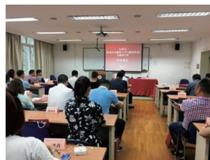
2019年6月18日,组织企业在上海财经大学举行企业上市专题研讨班

近年来,乐清市坚持把企业上市作为打造新引擎、重构新动能、提升新优势的重要抓手,在疫情防控常态化前提下,该市坚持统筹推进疫情防控和经济社会发展工作,深入实施“凤凰行动”计划,加速资本市场崛起,通过借船出海、借梯登高,全力打造企业上市“新高地”。近日,我省公布了省政府办公厅对设区市、县(市、区)予以督查激励的通报,乐清市获得2019年度“凤凰行动”计划专项督查激励。主要做法如下: