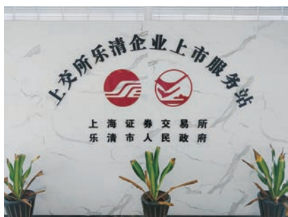
2018年1月26日,上交所乐清企业上市服务站正式挂牌启用