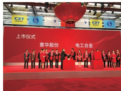
2017年9月7日,意华股份成功在深交所上市