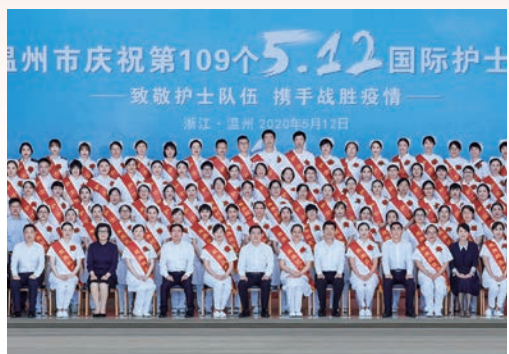
5月12日，我市开展“国际护士节”庆祝活动。此次新冠疫情，我市共有99人获评“浙江省抗击新冠肺炎疫情坚守前线杰出护士”，72人获评“温州市抗击新冠肺炎疫情坚守前线杰出护士”