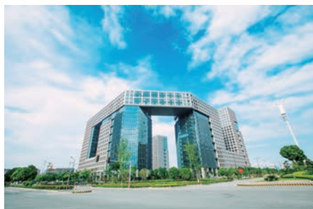
2015年12月,在乐清总部经济园专门设立投资基金类集聚区