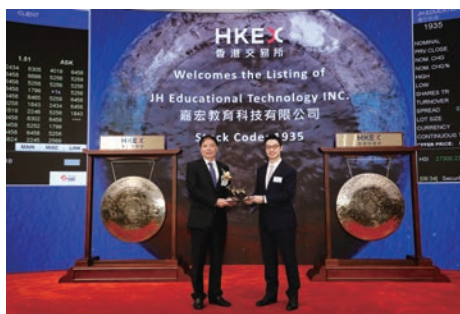
2019年6月18日,嘉宏成功在港交所上市