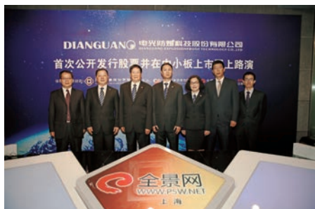
2014年10月9日,电光科技成功在深交所上市