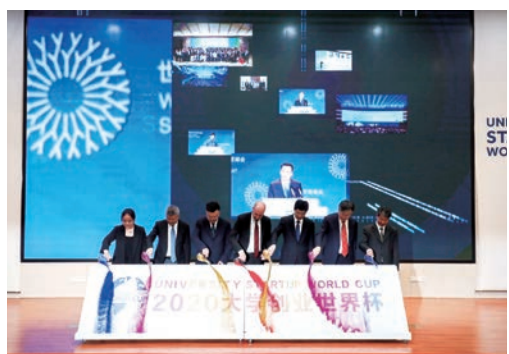
5月11日，由浙江省科学技术协会、温州市人民政府、丹麦大学联盟共同主办的2020大学创业世界杯暨中丹大学创新创业合作研讨会在我市启幕