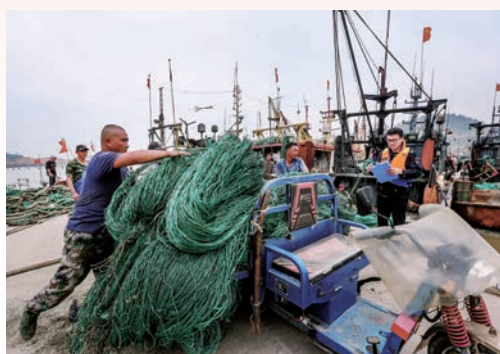
5月1日，我市全面进入海洋伏季休渔期，洞头东沙港码头的渔船井然有序地停在港内，渔民正在将渔网拉上岸