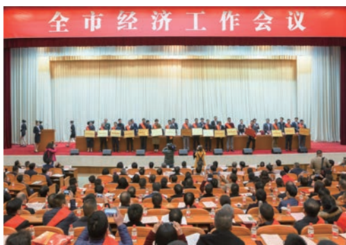
2月23日，市委市政府召开全市经济工作会议。