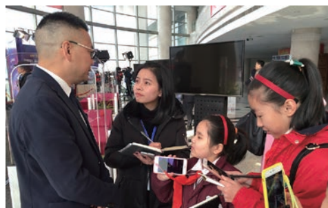
温网小记者探访“两会”现场 童言发问代表委员