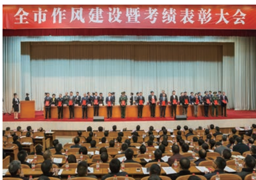
2月16日，市委市政府召开全市作风建设暨考绩表彰大会。