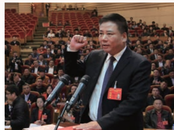
新当选温州市人大常委会主任葛益平就职时进行宪法宣誓

温州市第十二届人民代表大会第六次会议于2016年2月26日至2月29日在市人民大会堂隆重举行。会议听取审议并表决通过了张耕代市长所作的温州市人民政府工作报告、温州市国民经济和社会发展的第十三个五年规划纲要、温州市2015年国民经济和社会发展规划执行情况及2016年国民经济和社会发展规划、温州市2015年全市和市级预算执行情况及2016年全市和市级预算、温州市人大常委会工作报告、温州市中级人民法院工作报告、温州市人民检察院工作报告、《温州市制定地方性法规条例》等。