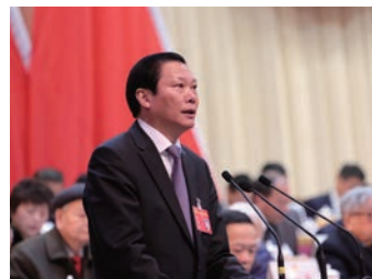
市政协主席余梅生代表政协第十届温州市委员会常委会作工作报告

中国人民政治协商会议第十届温州市委员会第五次会议于2016年2月25日至28日隆重举行。会议审议通过余梅生主席所作的政协第十届温州市委员会常务委员会工作报告，审议通过政协第十届温州市委员会常务委员会关于十届四次会议以来提案工作情况的报告，表彰了先进界别活动组、先进委员联络组、优秀政协委员和优秀提案。与会人员列席市十二届人大六次会议，听取并赞同张耕代市长所作的政府工作报告，赞同《温州市国民经济和社会发展的第十三个五年规划纲要（草案）》、市中级人民法院工作报告、市人民检察院工作报告及其他报告。