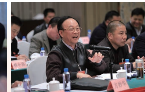
在市“两会”分组讨论现场，人大代表、政协委员建言献策，热情高涨