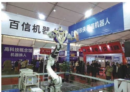
2月14日，第16届中国电器文化节暨国际电工产品博览会在乐清柳市开幕。