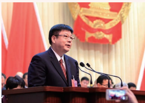
2月26日，温州市第十二届人民代表大会第六次会议开幕，代市长张耕作政府工作报告。