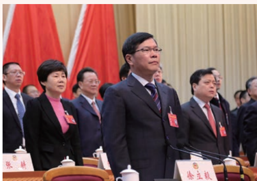
2月25日，政协第十届温州市委员会第五次会议开幕，市委书记徐立毅出席。