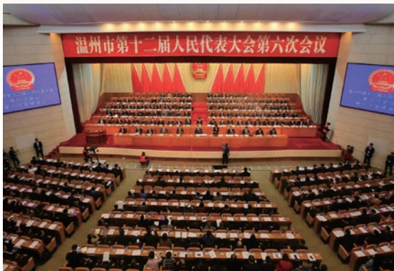
2月26日上午，温州市第十二届人民代表大会第六次会议在市人民大会堂胜利召开

温州市第十二届人民代表大会第六次会议于2016年2月26日至2月29日在市人民大会堂隆重举行。会议听取审议并表决通过了张耕代市长所作的温州市人民政府工作报告、温州市国民经济和社会发展的第十三个五年规划纲要、温州市2015年国民经济和社会发展规划执行情况及2016年国民经济和社会发展规划、温州市2015年全市和市级预算执行情况及2016年全市和市级预算、温州市人大常委会工作报告、温州市中级人民法院工作报告、温州市人民检察院工作报告、《温州市制定地方性法规条例》等。