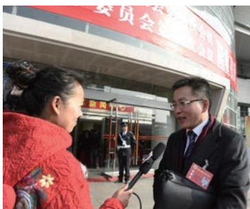
人大代表、政协委员接受采访