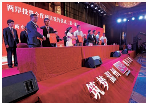
9月13日，2018浙江·台湾合作周第五届海峡两岸(温州)民营经济创新发展论坛在温启幕。图为两岸投资合作项目签约仪式。