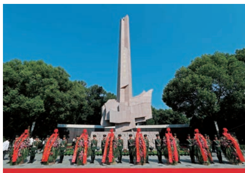
9月30日国家烈士纪念日，我市举行向烈士纪念碑敬献花篮活动，深切缅怀革命先烈。