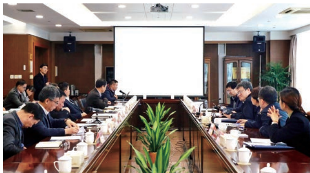
◎ 国家统计局领导来温现场观摩行业分类智能编码系统

强化创新引领服务改革发展。 温州获批全国唯一海洋经济统计制度创新国家试点城市,积极探索建立全国首个市县海洋经济统计制度,为国家统计制度设计提供温州样本,服务海洋经济强市战略。自主开发的行业分类智能编码系统填补全国统计系统空白,国家统计局认定属于全国统计系统重大技术创新,在全国推广应用。首创“三分工作法”服务机制,创新打造“局领导+处室负责人+业务骨干”组团服务模式,开展大规模业务培训,深入基层指导服务,得到县乡党政领导、广大企业经营者和群众的广泛赞许,国家、省统计局高度肯定温州做法并在全国推广。