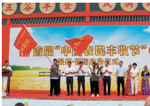
9月23日首届中国农民丰收节，2018年“中国农民丰收节”暨“我们的家园——万家农村文化礼堂庆丰收”温州·苍南庆祝活动开幕。