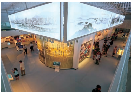
9月19日，温州道德馆正式开馆。