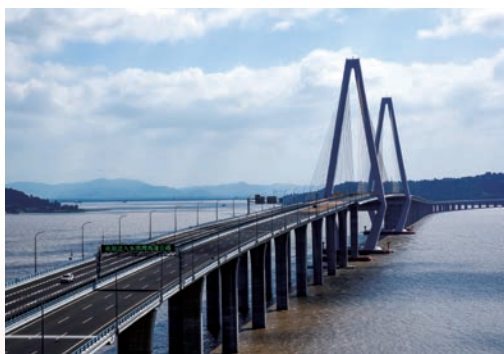
9月28日，乐清湾大桥及接线工程正式通车。