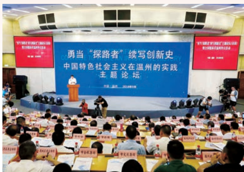
9月6日，“勇当“探路者”续写创新史”主题论坛暨全国媒体看温州主题外宣活动启动。