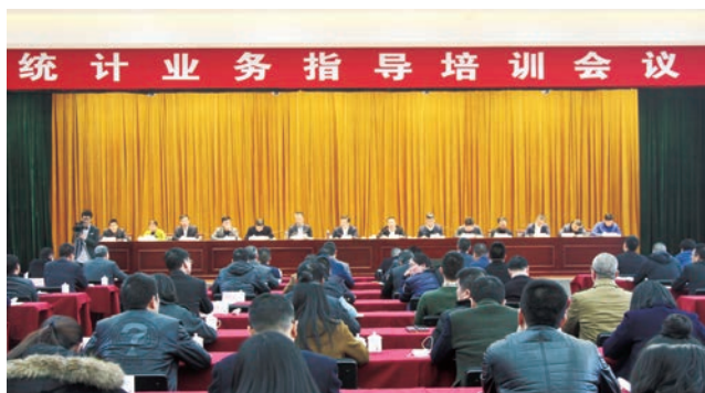
◎ 统计业务指导培训会议