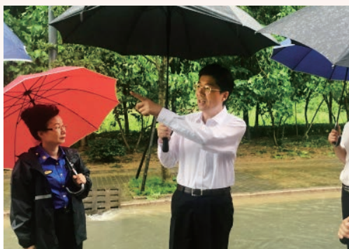
7月11日，市委副书记、市长姚高员赴瓯海区督查指导抗台救灾工作。