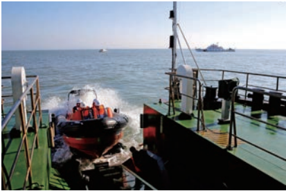
海上搜救综合演练

一是抓好水上安全，助力平安建设。 组织海上搜救行动78次，协调调派救助船279艘次、救助直升机19架次，救助遇险人员336名，成功率达94.35%。成功组织运输船舶避风1708艘次，在“泰利”等3个影响我市水域的台风影响