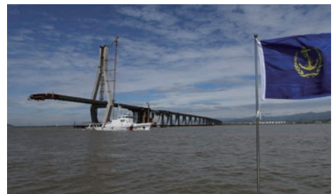
桥区水上交通安全监管

三是改革运行机制，优化便民服务。 坚持执法力量向重点口岸倾斜，完成基层执法机构改革。优化行政事项办理流程，承担的40主项、83子项“群众和企业到政府办事事项”，实现100%进驻政务窗口和100%“最多跑一次”。认真履行河长督察长职责，2017年度剿劣工作获优秀等次。持续改进政风作风和行政效能，获评全国文明单位，下属5个海事处实现浙江省文明单位全覆盖；获评全国海事系统廉政文化示范单位，家庭助廉作品《家书》在交通运输部汇报展示。