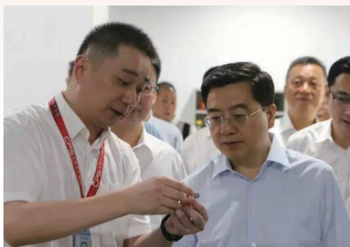
7月3日，市委书记陈伟俊赴正泰集团调研，实地考察传统制造业转型升级和新动能培育情况。