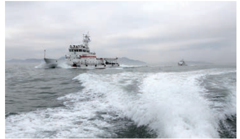
台风前联合大巡航

期，未发生沉船及人员伤亡事故。全年反映我市水上安全状况的四项核心控制指标（等级以上事故件数、死亡人数、沉船艘数和直接经济损失）低位运行（分别为8件、7人、5艘和1526万元）。