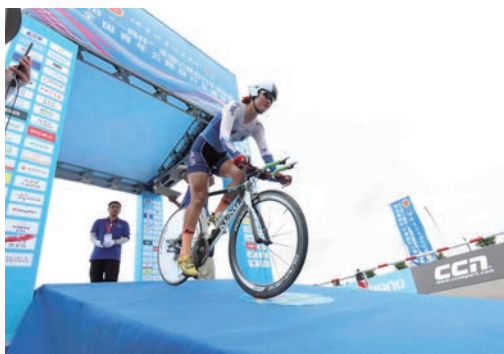
7月8日，为期6天的2018年全国公路自行车锦标赛暨全国青年公路自行车锦标赛在温州开赛。图为参加女子个人计时赛选手在比赛中准备出发。