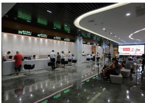
7月31日，温州市民中心正式挂牌启用。图为市民在新落成的市民中心办理各种业务。