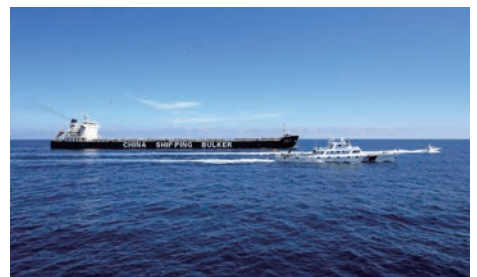
专属经济区常态化巡航监管