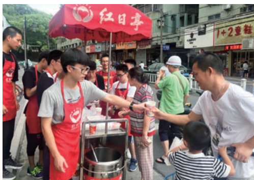
7月23日，一群来自温州中学的学生推着红日亭的流动小车，把一杯杯伏茶和银耳汤送给正在烈日下工作的交管人员、清洁工、出租车司机及路人。