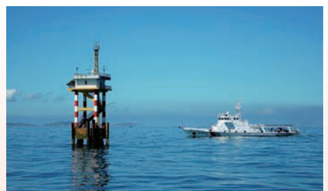
巡护我国首个领海基线外的观测平台