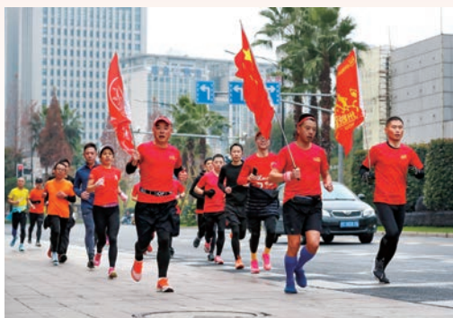
1月1日，我市第39届元旦健身跑首次线上举办，选手可在任意地点完成线下跑步、线上打卡，我市7952人奔跑迎“新”，“跑”进新年