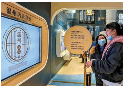
1月27日，浙江省首座方言馆——叮叮当童谣馆在温州松台山正式开馆