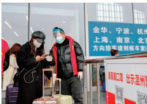
1月16日是春运第一天，铁路温州南站坚持防疫保畅两手抓，多措并举让旅客顺利便捷返乡