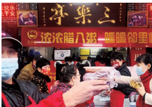
1月10日腊八节，温州市区上百个施粥点的义工们把一份份热乎乎的腊八粥分发给群众、清洁工、快递小哥和出租车司机等