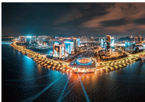
1月29日，除夕之夜的温州市区城市阳台、CBD显得绚丽多姿