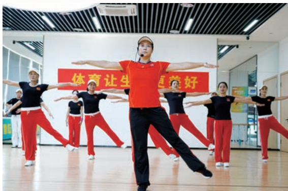
▲ 社会体育指导员在鹿城区南塘百姓健身房授课

四是强化数字化利用,做好“升级发展”文章。 开发全国首创的“温州百姓健身房”微信小程序。建成2.0版百姓健身房9家,3.0版百姓健身房1家。数字化百姓健身房配备智能化健身器材,具有多媒体网络功能。3.0版实现微信排名、科学指导、健身提醒等功能。满足多个百姓健身房异地网络实时比赛,提高趣味性和对抗性,打造后疫情时期群众健身的创新载体。