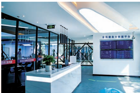
▲ 瓯海区智慧百姓健身房一瞥