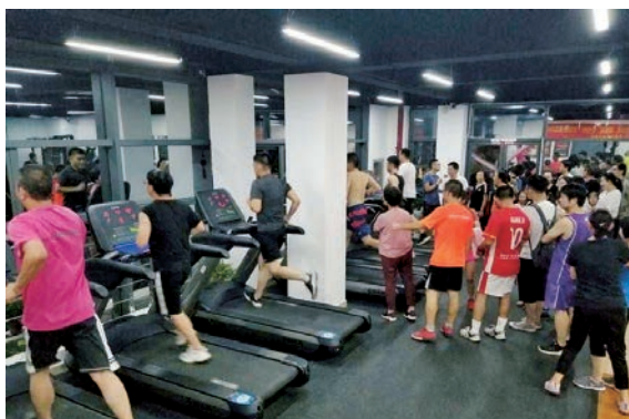
▲ 市民在百姓健身房锻炼