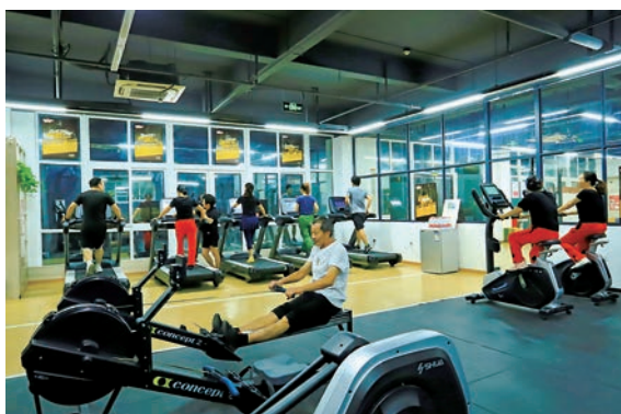
▲ 市民在鹿城区藤桥百姓健身房锻炼