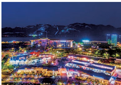
5月20日，以“全城嗨翻天·幸福乐不停”为主题的“2021年温州市月光经济幸福生活周”活动在鹿城区启幕