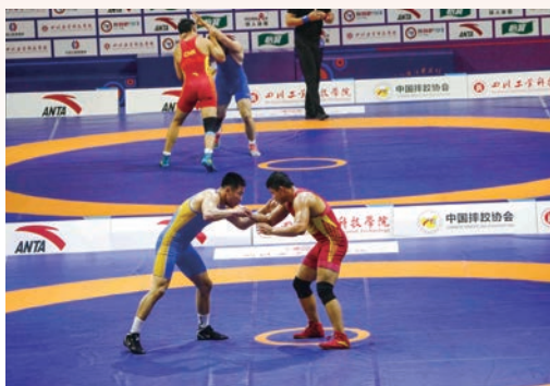
5月8日，全国国际式摔跤锦标赛暨第十四届全国运动会摔跤项目预赛在温州奥体中心体育馆举行，来自全国各地近100支队伍，近2000名运动员参赛