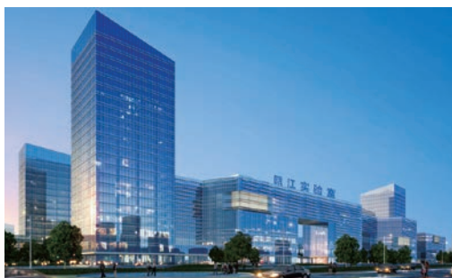
5月20日，瓯江实验室在我市正式挂牌，为我省生命健康领域再添“塔尖重器”，省委常委、温州市委书记陈伟俊，副省长卢山出席揭牌仪式