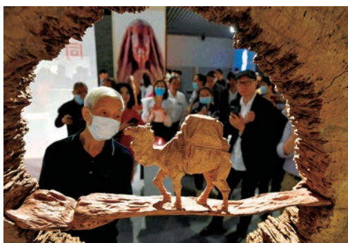
5月18日，第45个国际博物馆日到来之际，“命运与共——高公博百国之木雕刻艺术展”在我市博物馆拉开帷幕