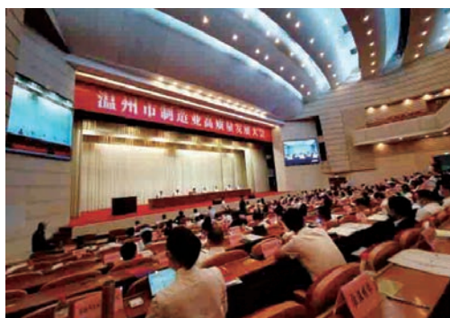
5月19日，我市召开全市制造业高质量发展大会，要求以数字化改革引领制造业全方位转型、系统性重塑，为建设“五城五高地”提供强有力支撑，奋力谱写全球先进制造业基地建设的温州篇章