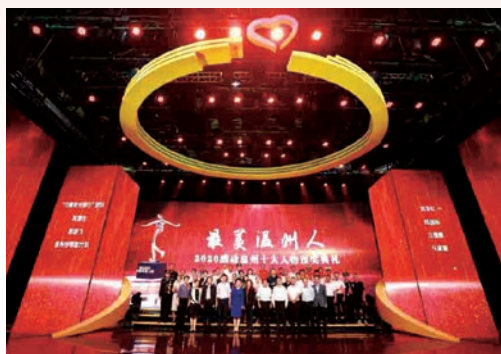
5月18日，2020“感动温州”十大人物颁奖典礼在我市广电中心举行