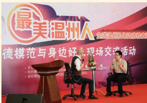
7月16日, “最美温州人”基层巡讲活动启动。图为首场基层巡讲现场。