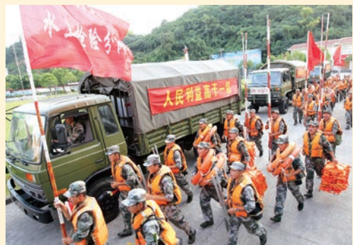
7月11日，温州军分区开展抗台抢险应急演练。