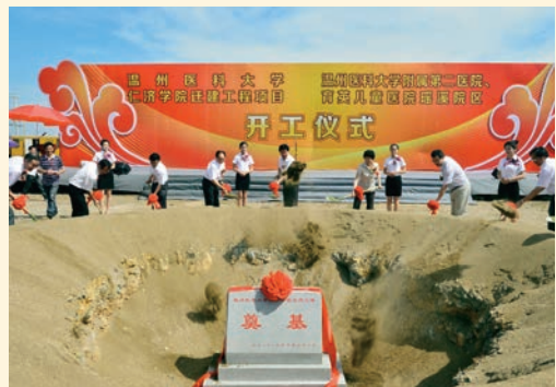
7月1日，温州医科大学仁济学院迁建工程及附属第二医院、育英儿童医院瑶溪院区开工仪式举行。