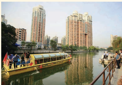
7月5日, 我市水上巴士在市区试运营。