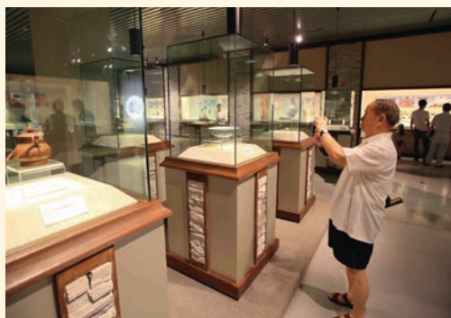
7月23日, 温州民间藏品展在市博物馆开幕。