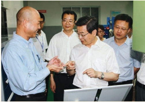
7月3日，市委书记陈一新赴温州经济技术开发区调研实体经济发展。