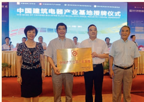
7月11日, 中国建筑电器产业基地授牌仪式在温州经济技术开发区举行。