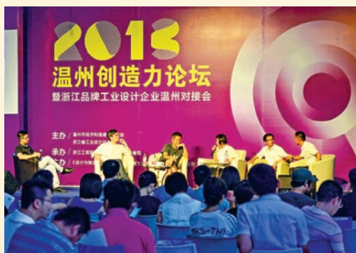
7月26日, 2013温州创造力论坛暨浙江品牌工业设计企业温州对接会举行。