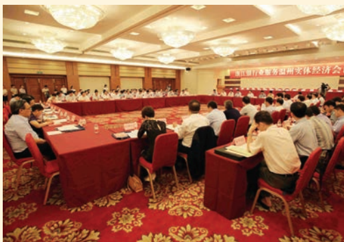
7月8日，浙江银行业服务温州实体经济会议召开。