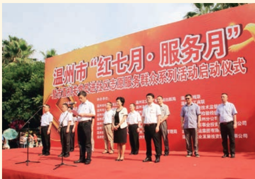
7月1日，我市“红七月·服务月”暨市直机关党员进社区志愿服务群众系列活动启动。