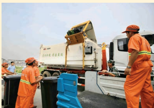
7月26日, 我市启动市区垃圾清洁直运试点工作。