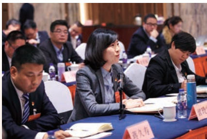
党代表们围绕党代会报告展开热烈讨论