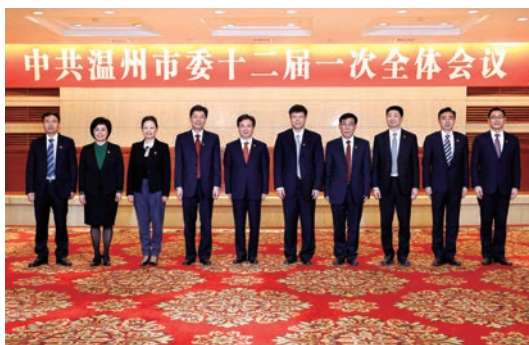
新一届温州市委领导班子亮相