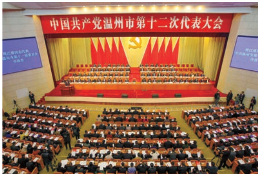
2月28日上午,中国共产党温州市第十二次代表大会在市人民大会堂隆重开幕

周江勇最后说,美好蓝图已经绘就,神圣使命重如泰山。让我们更加紧密地团结在以习近平同志为核心的党中央周围,在省委的坚强领导下,团结带领全市广大党员干部群众,振奋精神、顽强拼搏,砥砺前行、勇立潮头,巩固提升温州在全省的“铁三角”地位,奋力谱写浙江新方位下温州发展的辉煌篇章,为实现中华民族伟大复兴的中国梦作出新的更大的贡献。