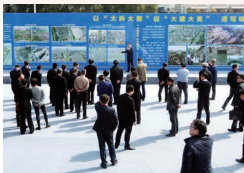
2月20日，全省城中村改造和危旧房治理推进会在市召开。图为会议代表参观考察横滨村城中村改造项目。