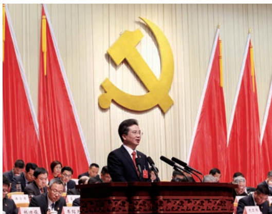
周江勇同志代表中共温州市第十一届委员会作题为《干在实处走在前列勇立潮头奋力谱写浙江新方位下温州发展的辉煌篇章》的报告