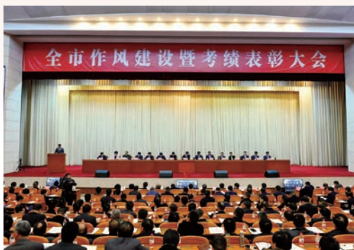
2月6日，全市作风建设暨考核表彰大会在市人民大会堂举行。