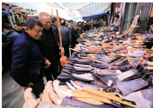
2月26日，有着200多年历史的“二月初一会市”在瓯海区瞿溪街道如期举办。