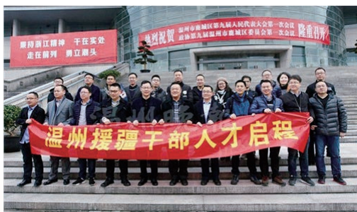
2月21日，我市第九批35名援疆干部人才启程。