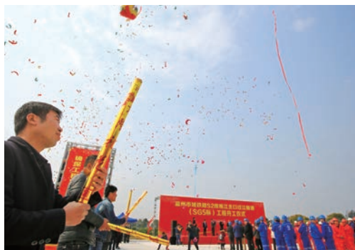
2月27日，市域铁路S2线瓯江北口过江隧道开工。