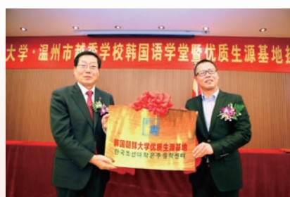
温州韩国优质生源基地挂牌成立