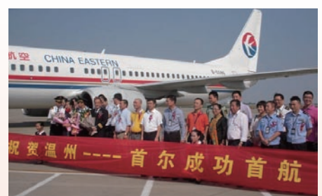
温州——首尔航线开通