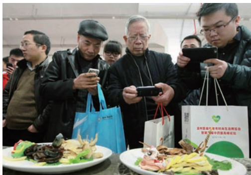
1月16日，我市首届中老年时尚生活博览会开幕。