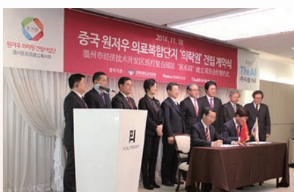
“医乐园”合作项目签约

2014年, 温州对韩国进出口总额达4.9亿美元, 其中出口3.9亿美元, 同比增长20.7%。市委、市政府明确表示, 今后, 要把对韩开放合作作为温州扩大对外开放的主攻方向, 以产业优化提升和经济转型升级为目标, 以“温州韩国产业园”为主平台, 积极创造更加优良的环境和条件, 全方位开展对韩经济合作, 提升对韩开放水平, 促进双方合作共赢, 全力将温州打造成中韩经济合作示范区, 为温州“赶超发展、再创辉煌”注入新的活力。