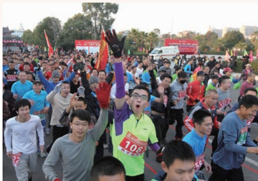
1月1日，我市2015元旦升旗仪式暨万人健身跑活动举行。