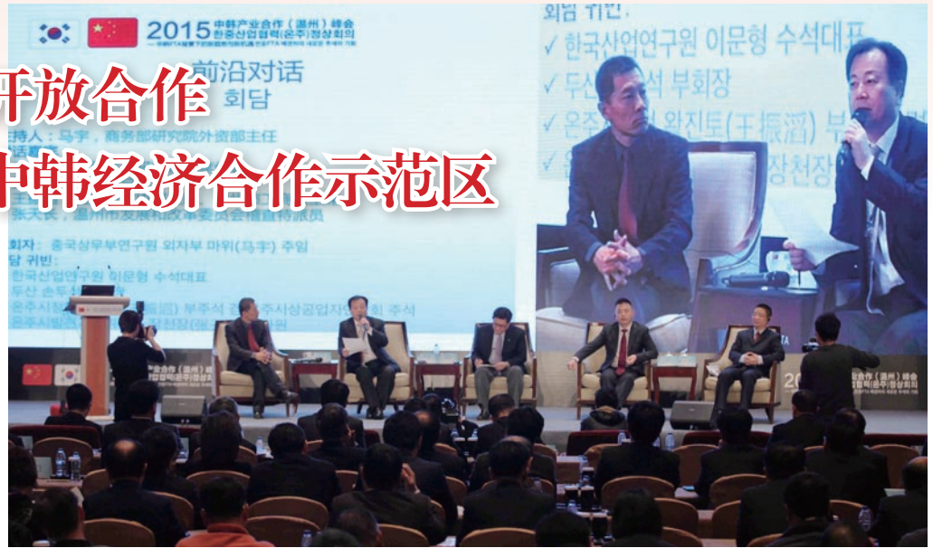
1月16日, 2015中韩产业合作(温州)峰会开幕, 图为峰会前沿对话