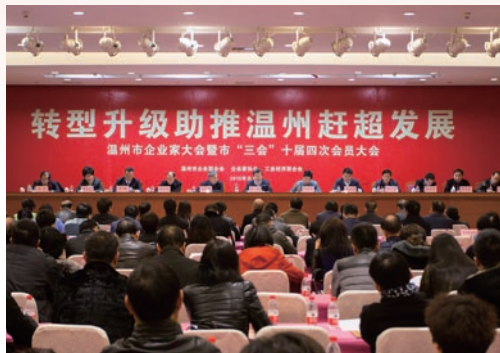
1月7日，我市企业家大会暨市“三会”十届四次会员大会召开。