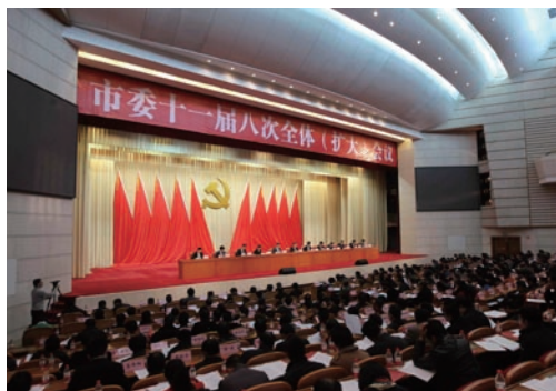
1月14日，市委十一届八次全体(扩大)会议召开。