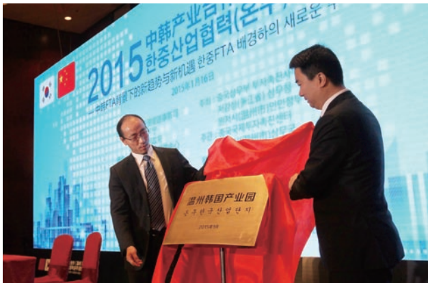
“温州韩国产业园”揭牌