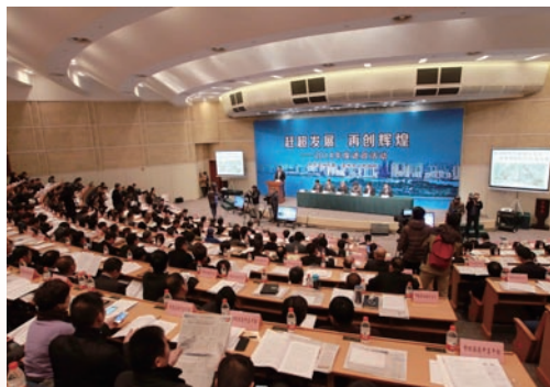
1月29日，我市启动县（市、区）和市直单位2014年度述职活动。