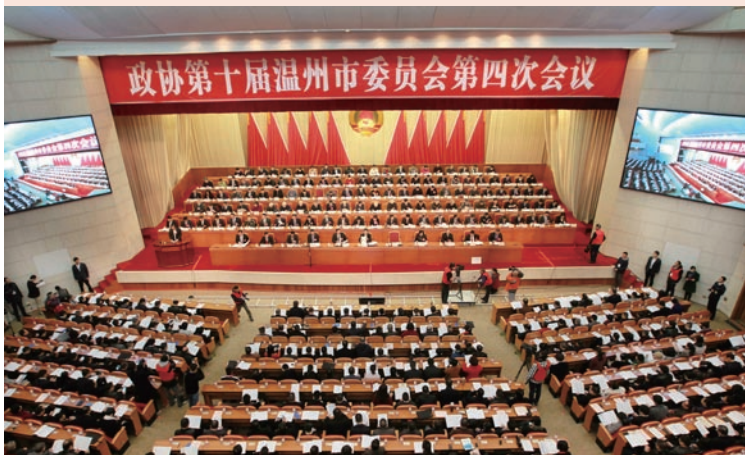
2月9日，政协第十届温州市委员会第四次会议开幕