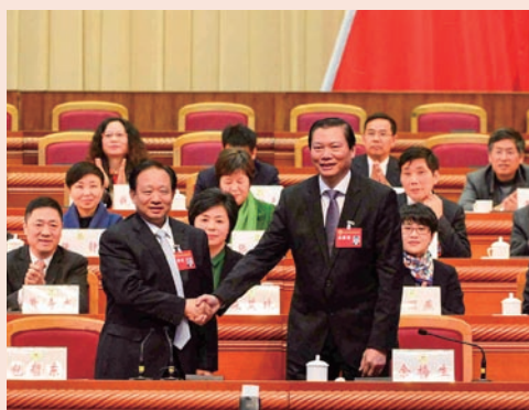
余梅生当选为温州市政协主席