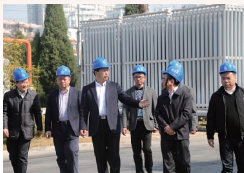
2月16日，市长陈金彪督查春节前安全生产工作。