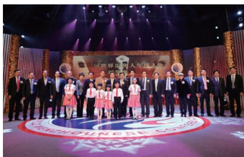
2月11日，第三届世界温州人年度人物颁奖典礼举行。