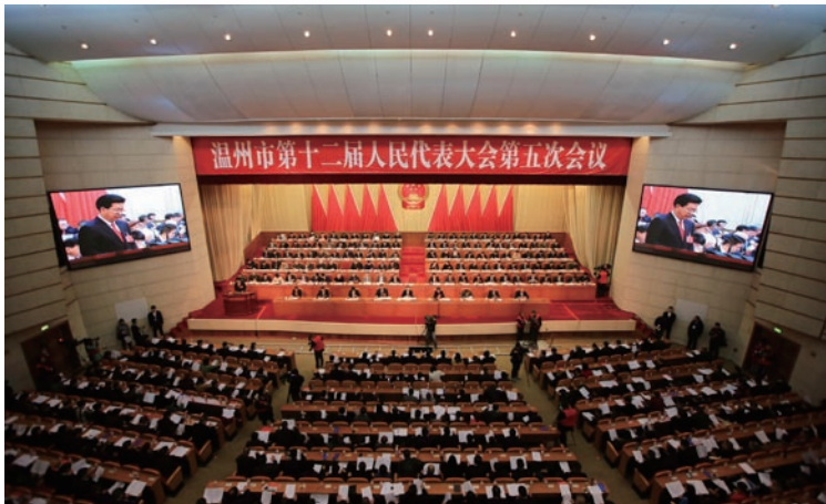
2月10日，温州市第十二届人民代表大会第五次会议开幕