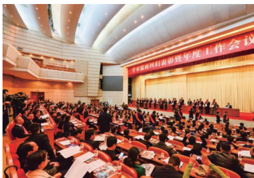
2月26日，全市温商回归表彰暨年度工作会议召开。