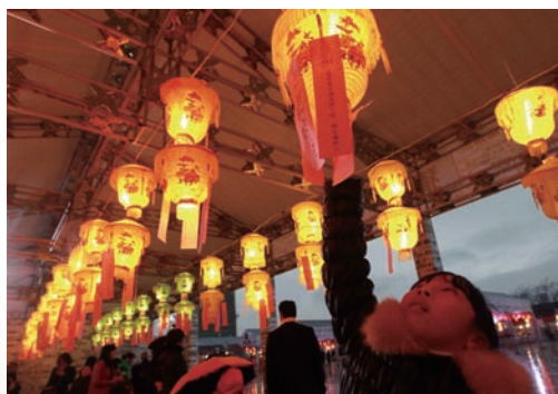
2月28日，2015温州灯彩节在市国际会展中心开幕。