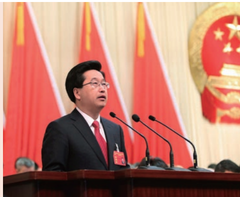
市长陈金彪在人大会议上作政府工作报告