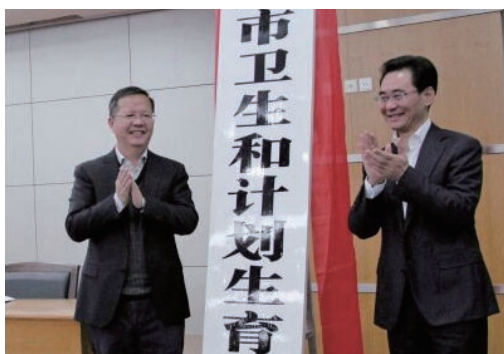
2月4日，市卫生和计划生育委员会挂牌成立。