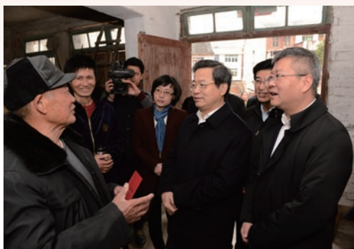
2月1日，省委常委、市委书记陈一新赴文成县巨屿镇开展挂钩帮扶和春节慰问活动。